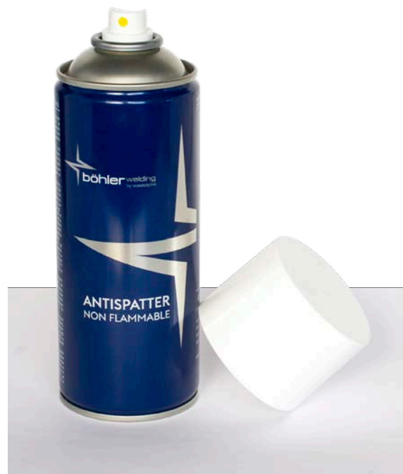
Spray anti-spruzzi BÖHLER Cartone contenente 12 bombolette da 400 ml